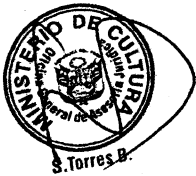
LUIS ALBERTO PEIRANO FALCONI Ministro de Cultura